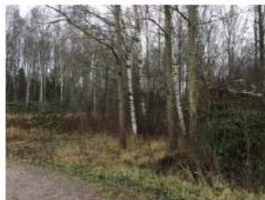
Aluetta 1, kuvassa muutamia alppiruusuja