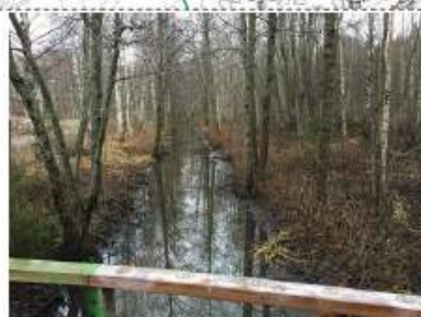
Näkymä kävelytien sillalta purolle