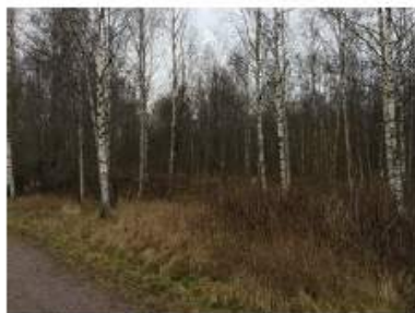
Alueen 1 lounaisreunaa