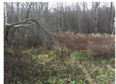
Alueen 1 pohjoisreunaa