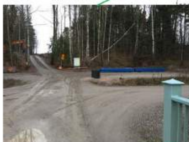
Näkymä Melatieiden sillalta Tankomäelle ja paikoitusalueelle