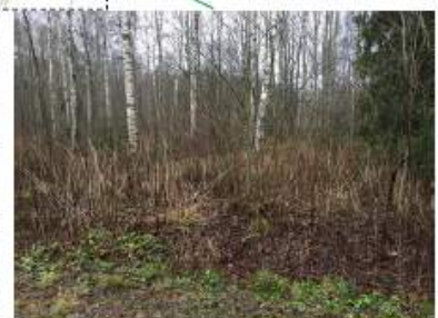
Aluetta 3 Kurkimoision puolelta katsottuna