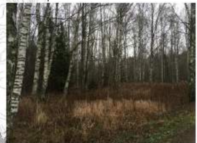
Alueen 2 lounaisreunaa